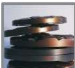
presse - papiers